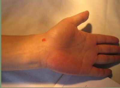
踝痛穴(失眠/心率不齊穴)：腕橫紋中，偏橈側 1 寸