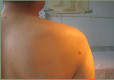
臀痛穴：肩峰至腋後皺壁連線的 1/2 處