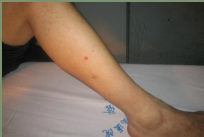
肩痛穴：足三里下 2 寸，偏於腓側 2 寸