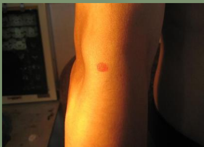
膝痛穴：肘關節背側面的正中點（手心向下，肩關節與腕關節連線的中點，將臂伸直的最高點）